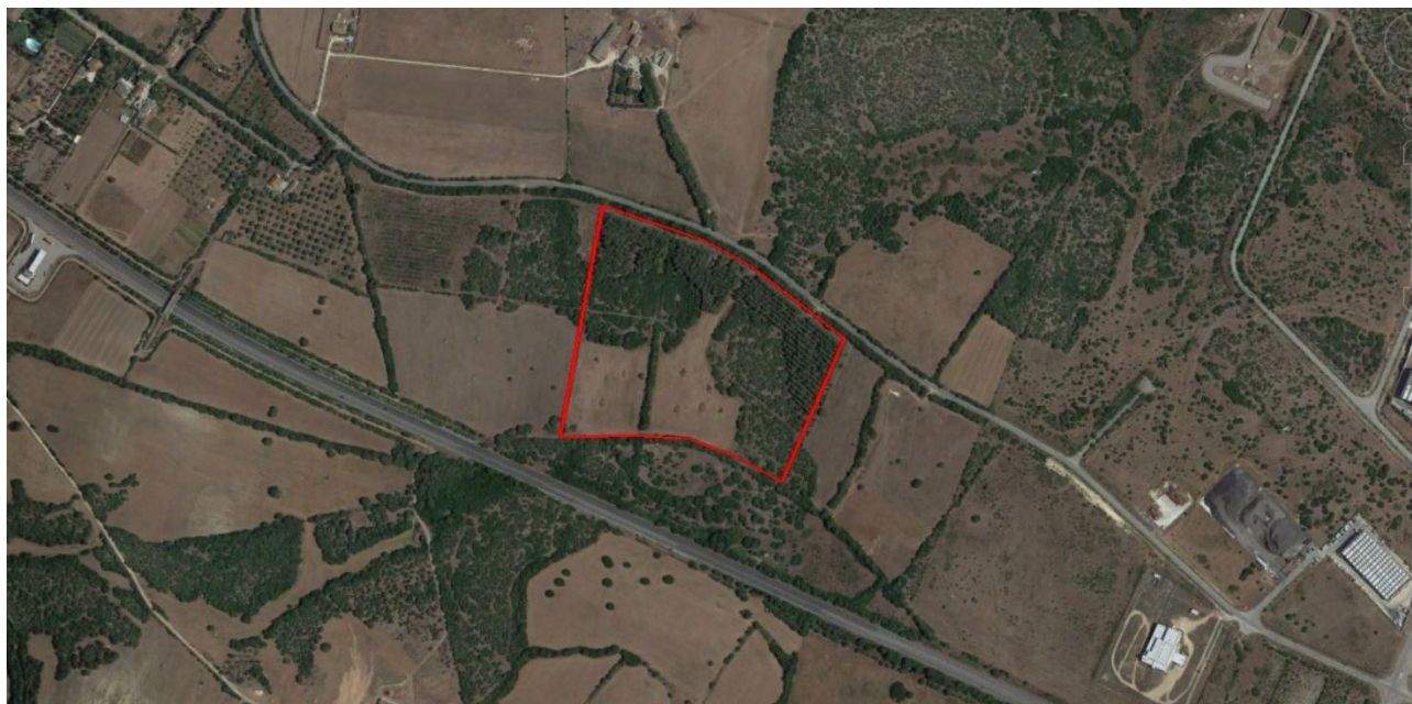
Fig. 1: Area di intervento.

Dal punto di vista topografico, l’area in esame risulta inclusa nella cartografia catastale al foglio 18, particelle 268 del comune di Sassari, terreni localizzati nella ZONA AGRICOLA E secondo quanto documenta il Certificato di Destinazione Urbanistica (CDU).