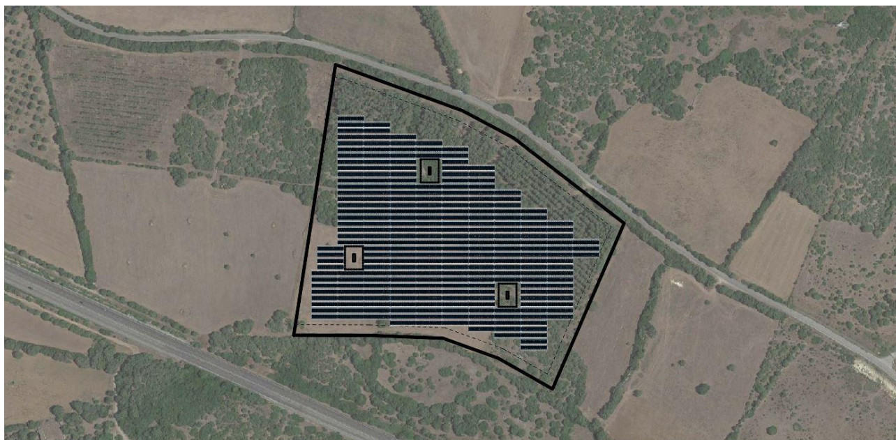
Fig. 3: Posizionamento impianto su ortofoto.

La linea in corrente continua 2*6mmq tipo FG21M21, che dai moduli arriva all'inverter, verrà posizionata all'interno di una canale metallica con fissaggi ogni 2m e fissata direttamente alla struttura di supporto dei pannelli quando possibile; in prossimità del punto nord della struttura di fissaggio verrà realizzato un cavidotto interrato, con pozzetti come individuato nelle tavole grafiche.