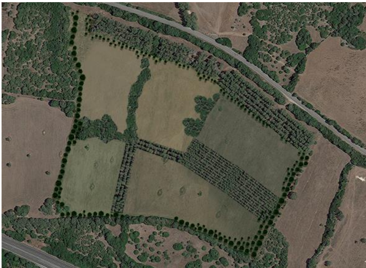
Fig. 8: Riqualificazione ambientale del sito dopo la dismissione dell'impianto.

Il tipo di terreno è idoneo alla piantumazione delle essenze mediterranee, in quanto trattasi di terreni sabbiosi.